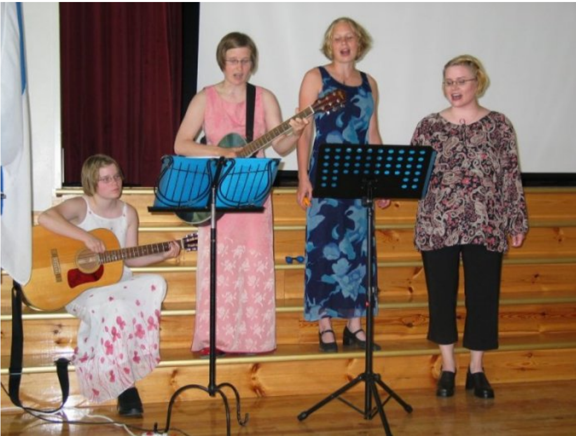
Too Many Sisters keräsi sukujuhlan kovimmat aplodit, vaikka esiintyjät eivät olleetkaan Rahkosia, vaan Koskenlahden sisaruksia Saarijärveltä.