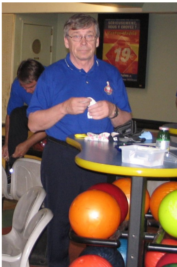
Sormien teippausta ennen ensimmäistä peliä.

Juna Nantesista saapui Montparnassen asemalle. Valitsimme tutustumiskohteiksi Eiffel-tomin, Riemukaaren ja Notre Damen kirkon. Nehän ovat kohteita, joihin jokainen turisti haluaa tutustua. Pariisissa turistin on hyvä käyttää liikkumiseensa eri paikkojen välillä metroa. Eiffel-tomilla oli kuitenkin usean tunnin jonot, joten päätimme luopua noususta huipulle. Vähän aikaa ihmeteltyämme palaisimme takaisin metroom ja Riemukaarelle. Sitten menimme taas metrolla Notre Damen