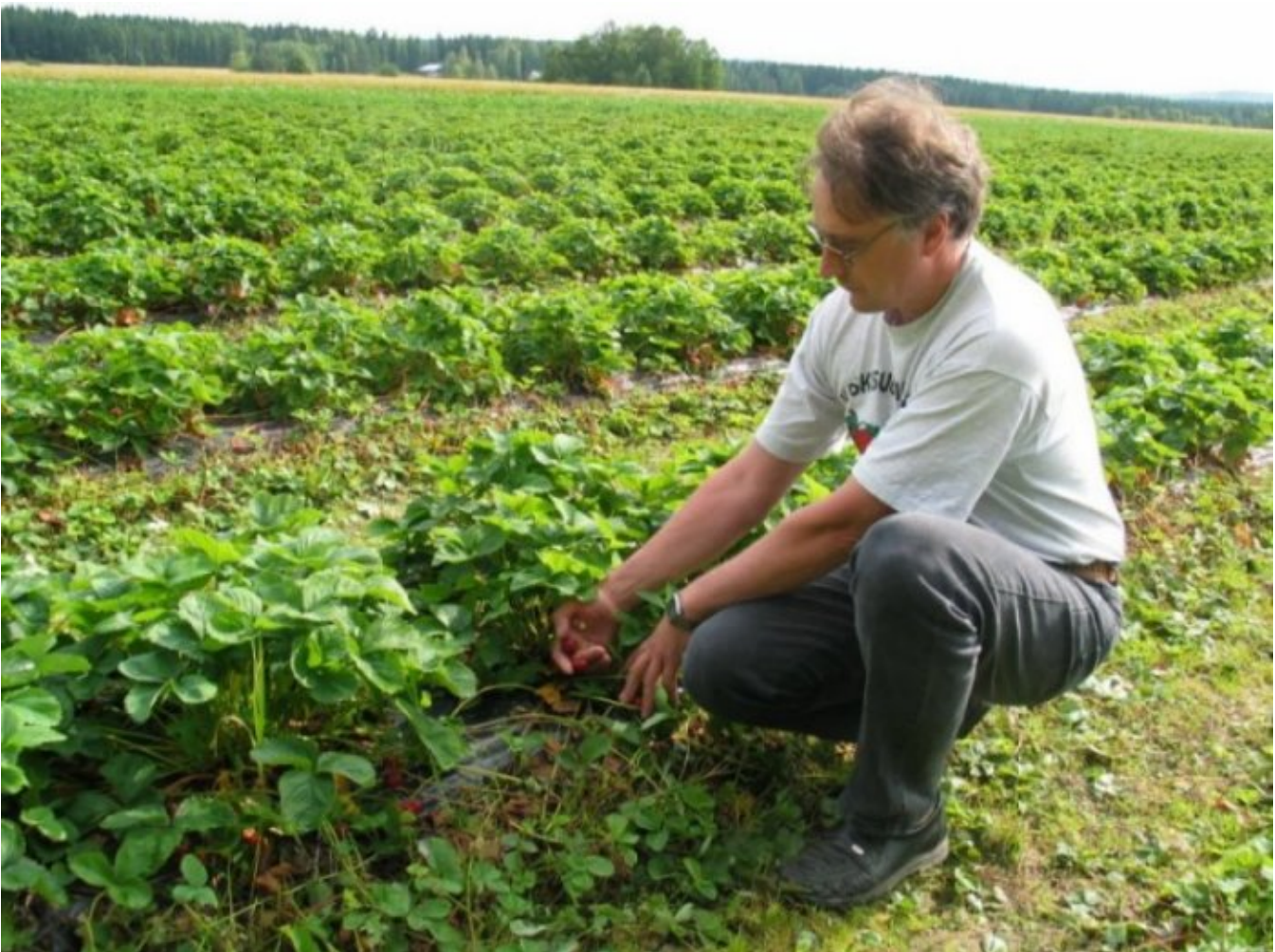
Jukka Rahkosen tilan mansikoista valtaosa menee itsepoimijoille.